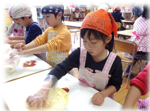
調理保育も盛んです